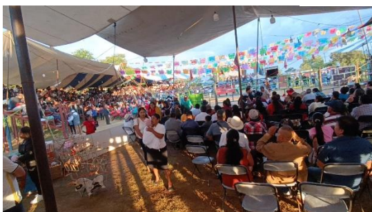
IMAGEN 2 JARIPEO ANUAL, IRIS ESMERALDA CRUZ